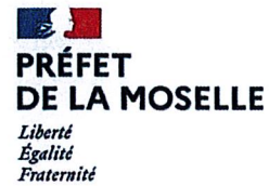
SCHÉMA DÉPARTEMENTAL D'ACCUEIL ET D'HABITAT DES GENS DU VOYAGE